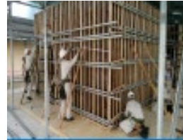
技能訓練の様子<型枠>

是非とも貴社の経営戦略に組み込み、起用をご検討いただけますようお願いいたします。