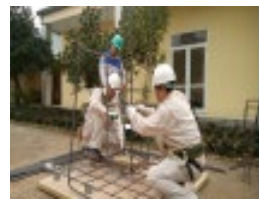
技能訓練の様子<鉄筋>