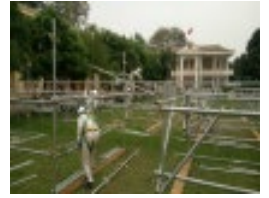
技能訓練の様子<とび>