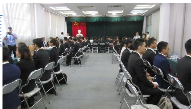
*写真はイメージであり、実際のものとは異なります

参加企業各社が専用ブースを構え、そこを訪れる学生に対して会社紹介や面接などを行う ジョブフェア形式 で進行します。ベトナムの大学等との連携により、意欲ある学生が多数参加します。説明会等を通じて、その中から有望な学生との交流をしていただきます。