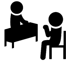
個別説明 就職相談会 ※通訳がサポート